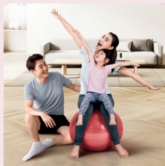
環宇盈活儲蓄保險計劃