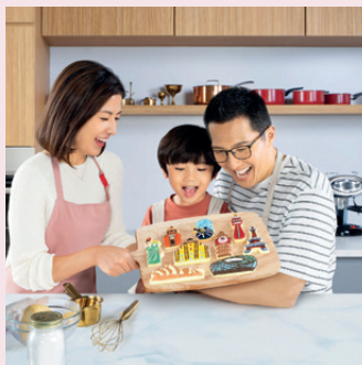
「盈御多元貨幣計劃3」