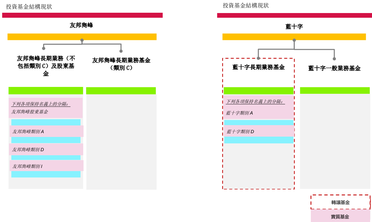
圖 3.2: 友邦雋峰在計劃實施後的基金結構