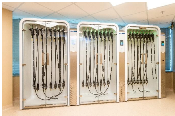
中心採用現時最先進的儀器，包括腸胃鏡清洗機及保持無菌狀態之腸胃鏡儲存鏡櫃。